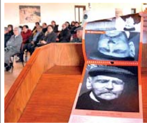
La presentazione del calendario