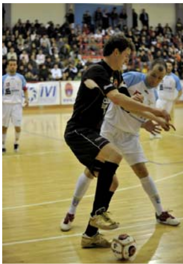
Una partita di calcio a cinque

In Promozione il Cabras perde in casa contro Le Pleiadi (45 a 56). Il Mogoro vince il derby contro il Basket Oristano 65 a 58. Sconfitta esterna per il Ghilarza per 68 a 54 a Serramanna. Sabato alle 18 il derby tra Ghilarza e Mogoro; domenica alle 17 il Basket Oristano ospita il Karel B, mentre alle 18 il Cabras gioca a Sestu. In Prima Divisione il Marrubiu-Sinnai 65 a 47. Venerdì i marubiesi ospitano il Karalis alle 21.15. (g. pa.)