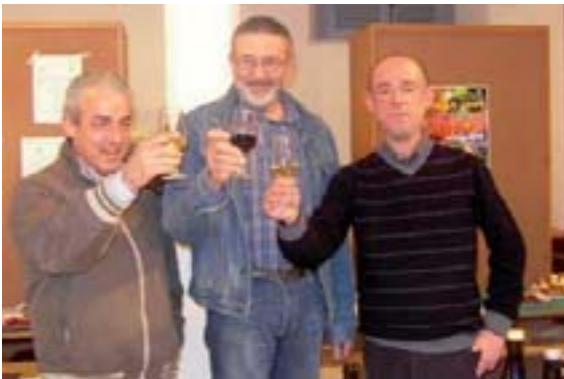
Alcuni vincitori del concorso di Uras (an. pin.)