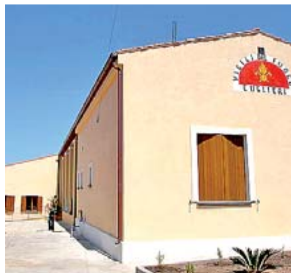
La nuova caserma dei vigili del fuoco [A.C.]

La caserma dei vigili del fuoco intitolata a Giovanni Ponte ha iniziato ieri ufficialmente la sua attività. «La nostra amministrazione ha da sempre contribuito alla realizzazione del distaccamento, investendo 400mila euro, a fronte degli 800mila del costo totale - afferma il sindaco Giovanni Battista Foddis - Ora mi auguro diventi di tipo misto, con inserimento di vigili effettivi affianco agli attuali 40 volontari». Lo rassicura il sottosegretario agli Interni Nitto Francesco Palma che garantisce «un impegno costante per raggiungere l'obiettivo della trasformazione del distaccamento con l'inclusione, a breve, di effettivi».