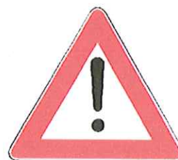
fig. 309 art.135 (Segnalazione strada senza uscita )

- fig. 35 art.103 (Segnalazione di pericolo)